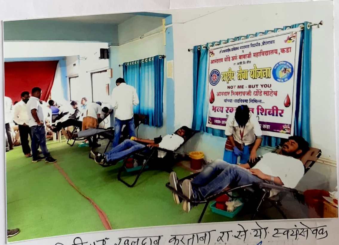
रक्तदान शिबीरात रक्तदान करतावा रा.से.यो. स्वयंसेवक

Programme Officer N. S. S. Unit A. D. Mahavidyalaya Kada, Tal. Ashti, Dist. Beed.